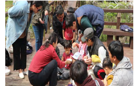
아빠! 공원에서 놀아요

육아종합지원센터에서 진행되는 꿀잼 체험프로그램은 선착순으로 접수를 마감합니다. SNS(페이스북(제주도), 인스타그램(서귀포시))를 팔로우하거나 홈페이지를 통해 기간을 확인한 뒤 신청해주세요. 육아종합지원센터 뿐 아니라 제주도내 여러 관련기관에서도 다양한 프로그램을 운영하고 있으니 43쪽 '제주도내 관련기관' 홈페이지를 참고하세요.