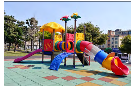
서귀포시 기적의 도서관 놀이터