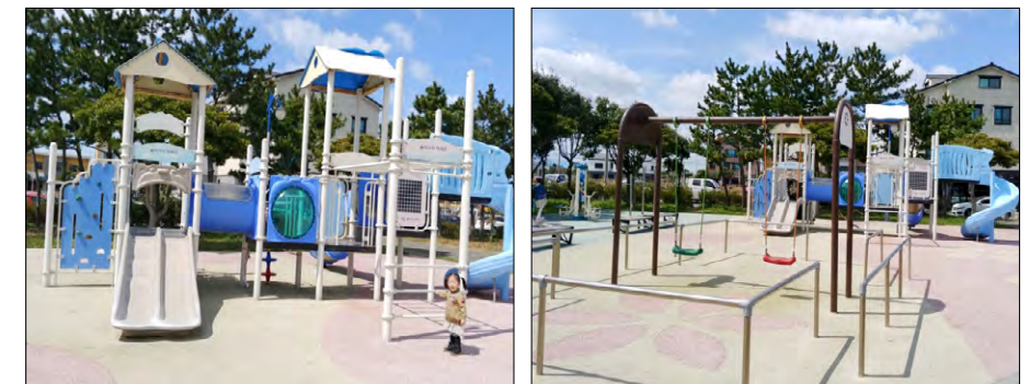
함덕 1호 어린이공원 놀이터