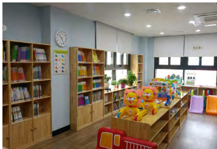
장난감 및 도서대여실

서귀포시육아종합지원센터 는 서귀포시 영유아 가족에게 양질의 보육 환경과 육아 정보를 제공하기 위하여 장난감및도서대여실, 시간제보육실, 영유아놀이실, 체험실을 운영하고 있습니다.