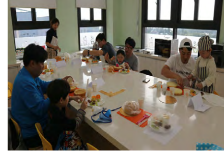
아빠와 함께하는 요리교실

다양한 가족체험을 통해 가족을 이해하고 소중함을 느껴, 행복한 양육문화를 조성해 나갈 수 있도록 지원합니다.